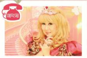
빨간 드레스를 입고 환갑 기념 사진

일본에서는 60세가 되면 소매없는 빨간색 걸옷을 입고 축하합니다. 그러나 이가라시 유미코 미술관에서는 빨간 드레스를 입고 축하합니다.