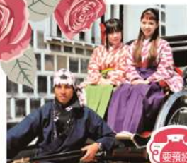
體驗箭翎狀花紋和服褲裙

可以體驗身穿「倉敷故事」之主人公八幡小姐的衣裳之樂趣。附帶 2 小時之散步活動。於美觀地區身穿箭翎狀花紋和服褲裙散步非常適宜。