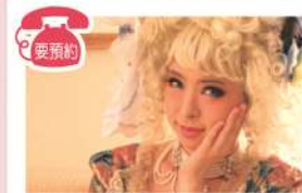
整髮 & 化妝服務