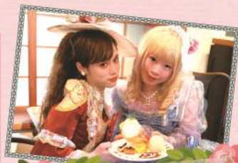
身穿禮服品嚐甜點和午餐

可以體驗身穿「倉敷故事」之主人公八幡小姐的衣裳之樂趣。附帶 2 小時之散步活動。於美觀地區身穿箭翎狀花紋和服褲裙散步非常適宜。