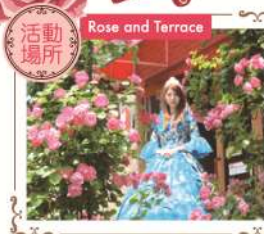
Rose and Terrace